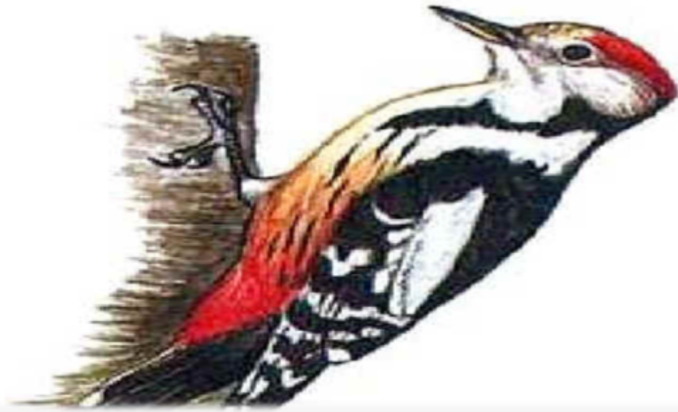
Чистая прима, ч.1 (дятел)