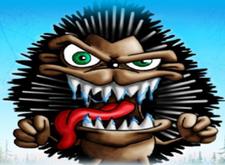
Малая секунда, м. 2 (злой ёжик)